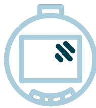
1,5 inch LCD scherm