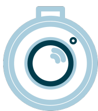
Compact rond ontwerp